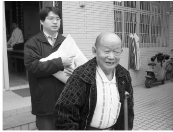
△協助老人家搬白米。