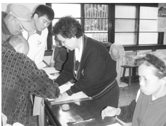
△工作人員核對資料。