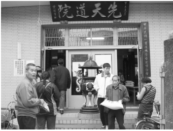
△道院發放白米有40年歷史。