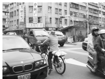
△領白米已經換了五部腳踏車。