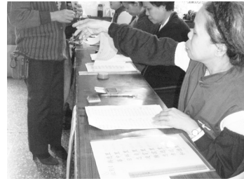
△美珠姐(右)每年主動報到。